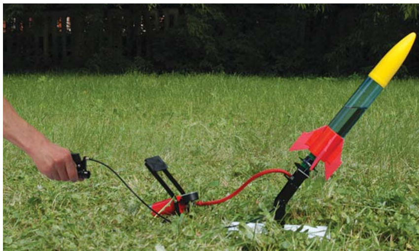
Рис. 1. Приведение в действие дистанционного пускового механизма

Игрушка была куплена через интернет-магазин умных развлечений «Семь пядей» ( www.7pd.ru ).