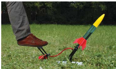
Рис. 2. В ракету на пусковой установке накачивается воздух

В зависимости от массы налитой в ракету воды и давления воздуха в ней ракета при вертикальных пусках поднималась на разные высоты. В некоторых случаях она поднималась выше 14-этажного дома, что тут же вызывало многочисленные и разнородные комментарии собравшихся маленьких и больших зрителей. Один мальчик пяти-шести лет никак не хотел уходить, несмотря на обещание мамы дать ему посмотреть дома фильм не только со стрельбой ракетами, но и со стрельбой из танков и пушек. По-видимому, быть свидетелем или участником запуска «живой» ракеты оказалось более интересным занятием, чем пассивный просмотр фильма о пуске ракет на экране телевизора или монитора компьютера.