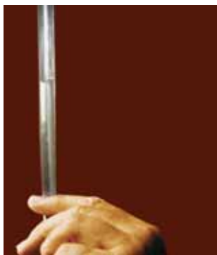
Рис. 4. При высоте столба воды больше 10 метров в верхней части трубки вода действительно отделяется от верхнего торца трубки

Для измерения атмосферного давления с помощью такого барометра после заполнения трубок водой необходимо отмерить от свободной поверхности воды в бутылке 10 метров трубки и сделать на ней метку. Такая метка удобна, если атмосферное давление немного превышает 10 метров водяного столба. При проведении опыта, удерживая вертикально стеклянную трубку, пластиковую бутылку на шланге постепенно спускайте вниз до тех пор, пока вода в стеклянной трубке не оторвётся от пробки и не начнёт опускаться (рис. 4).